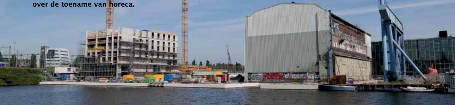
Zicht vanuit de vaart met de kranen van Stork (2012).

Vrijdag 5 juli was er een Meet & Greet bij café-restaurant Rosa en Rita aan de Conradstraat. De buurt was uitgenodigd om in informele sfeer te praten over de ontwikkelingen op Oostenburg. Er waren onder meer jongerenwerkers en buurtbewoners, die bezorgd zijn over de toename van horeca.