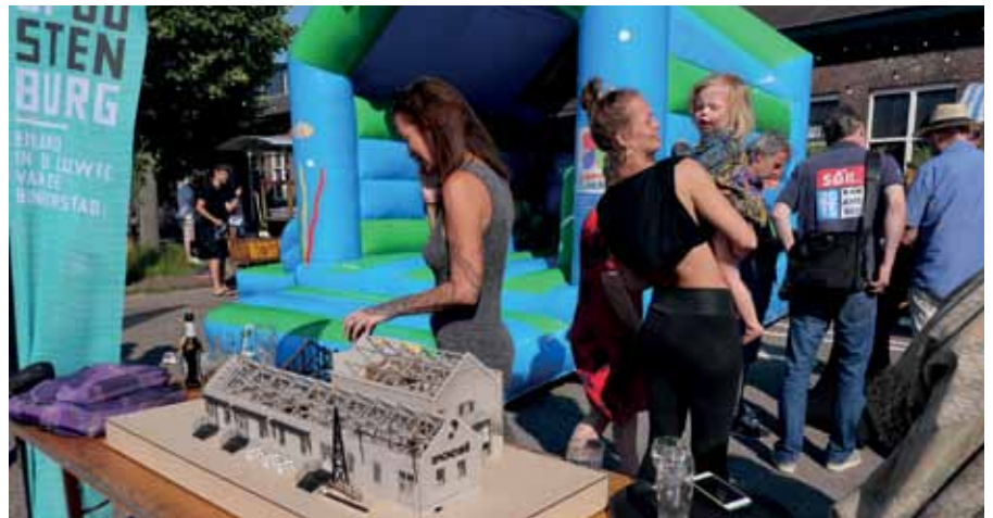
Tijdens de borrel konden bewoners en betrokkenen de maquette bekijken

gemeenschappelijke ruimtes komen, met een dichte bebouwing. Er worden ongeveer 1500 woningen gebouwd. Op de site: www.oostenburg.nl staat dat het de bedoeling is dat er een mooie mix van sociale, middensegment, vrije sector huur, koopwoningen zelfbouwwoningen, ontspanningsplekken, horeca en bedrijvigheid komt.